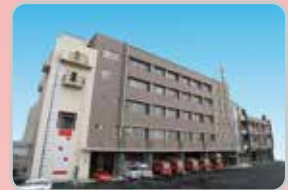
消防局・中消防署