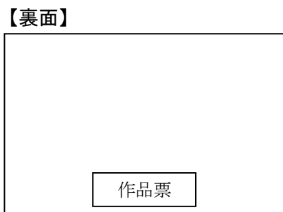
【 作品が横向きの場合 】